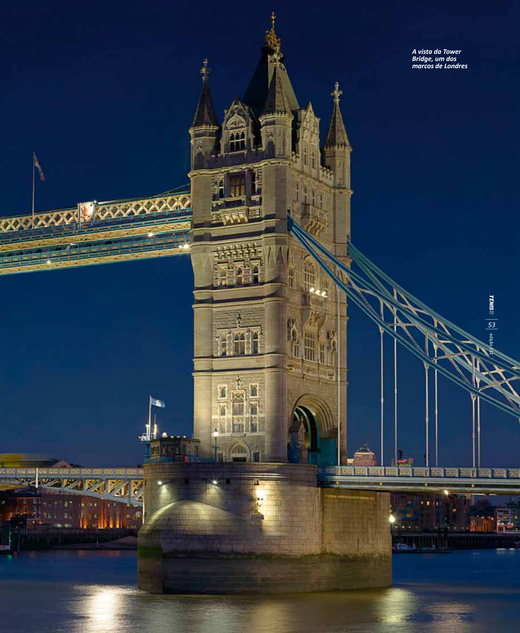
A vista da Tower Bridge, um dos marcos de Londres